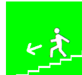
Scala di emergenza